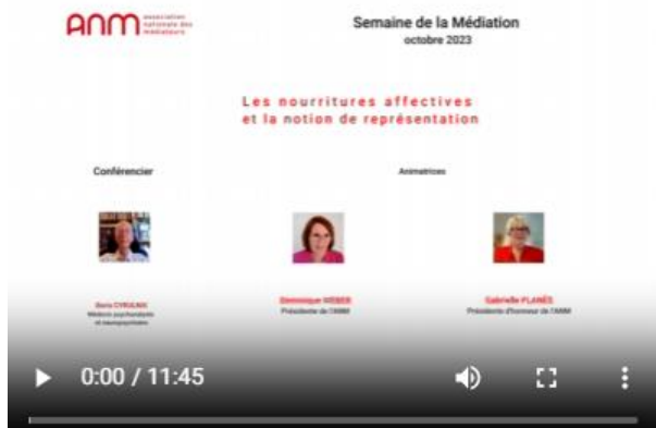
Page ANM de la Semaine de la Médiation

Nous vous souhaitons un bon visionnage !